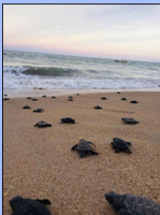
Filhotes de Tartaruga-gigante a caminho do mar, Tailândia

Até que ponto deves mudar o teu comportamento aos tempos que vivemos? Faz sentido tentares mudar o mundo?