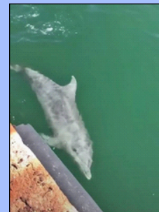
Golfinho no canal de Cagliari, Sardenha