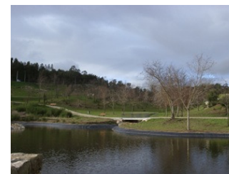
Vista sobre o Lago

Antes do Lago, surge do lado esquerdo o Parque de Merendas, com mesas e bancos em granito, uma das inúmeras aplicações deste material, onde mais tarde poderá realizar um piquenique, rodeado pelas espécies de árvores características do parque e ouvindo o som da Ribeira que passa mesmo ao lado.