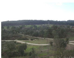
Vista da Torre de Vigia

Curiosidades: o acto de retirar cortiça designa-se de Desboia, ocorrendo em períodos de 9-10 anos, através da qual são retirados entre 40 a 60 kg de cortiça até aos 150 a 200 anos de idade. Um Sobreiro jovem começa a produzir cortiça a partir dos 25-30 anos.