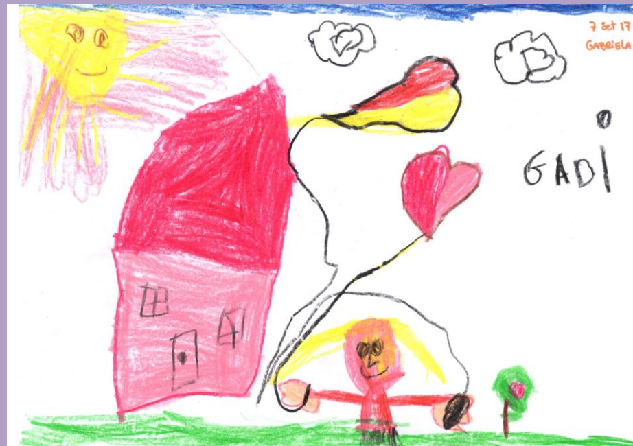
A Gabriela Madanços tem 4 anos e é da sala 2