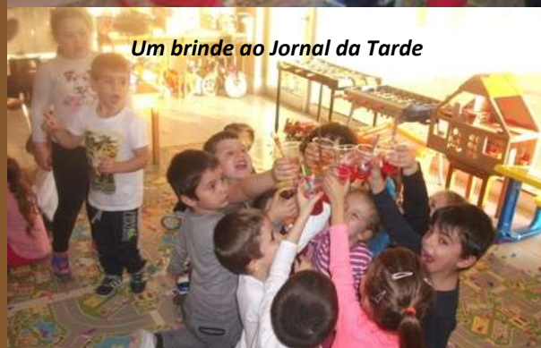
Um brinde ao Jornal da Tarde