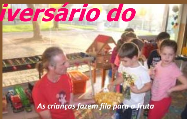
As crianças fazem fila para a fruta

A todas as pessoas e a todas as entidades que tornaram possível este evento em todo o seu conjunto o meu muito e eterno obrigado em meu nome, em nome da escola e em nome das crianças!