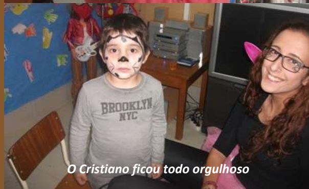
O Cristiano ficou todo orgulhoso