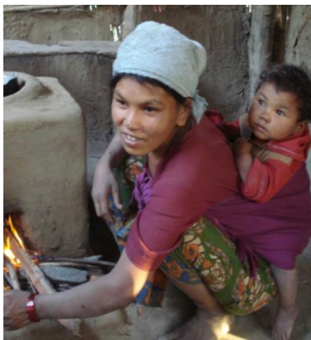
Uma mãe no Peru a cozinhar num fogão ao ar livre.