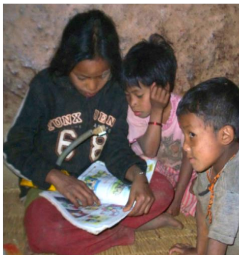
Crianças nepalesas estudam à luz de um candeeiro a energia solar.