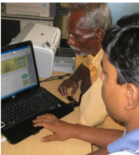
Agricultores do Bangladeche a consultar a internet.