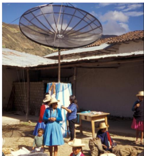
Uma antena parabólica alimentada a energia solar no Peru.