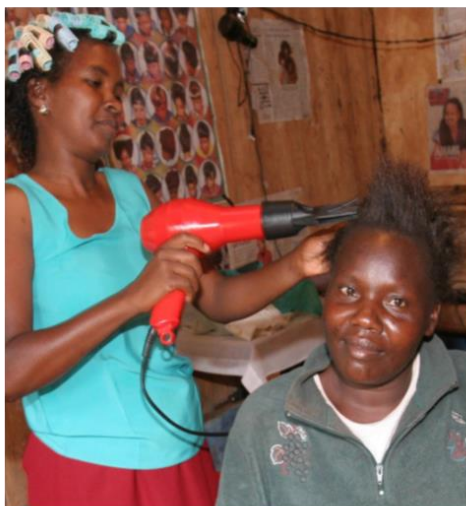
Uma proprietária de um cabeleireiro no Quênia.