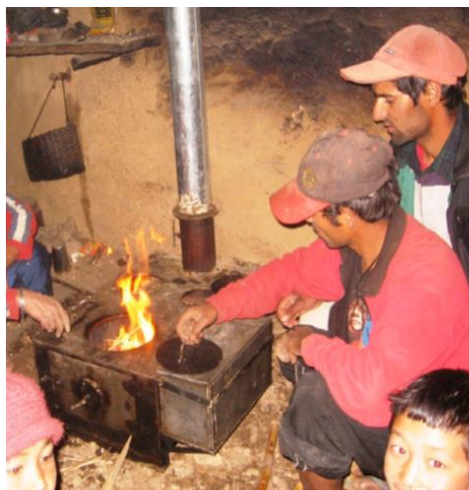
Uma família nepalesa a usar um fogão a lenha para cozinhar e aquecer.