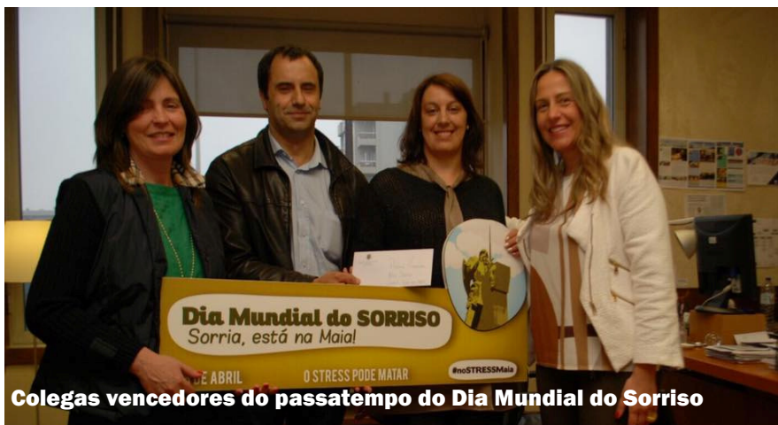
Colegas vencedores do passatempo do Dia Mundial do Sorriso

Deu-se igualmente a feliz circunstância de paralelamente se assinalar o Dia Mundial do Sorriso. Sendo o ato de sorrir reconhecidamente um dissuasor do stress, nada melhor do que reforçar o slogan “Sorria, está na Maia!” que é já a nossa marca identitária.